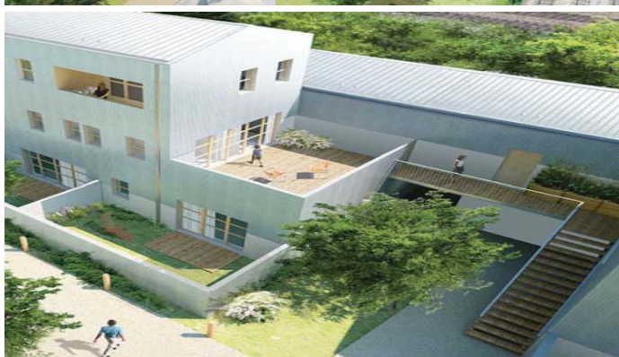
Secteur 3 - Projet lauréat, © Dream + SOA architectes